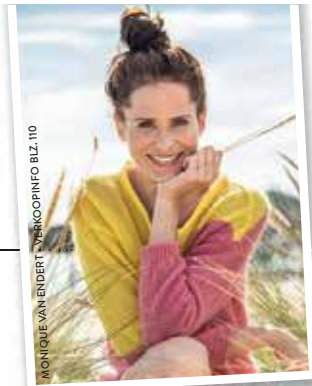
MONIQUE VAN ENDERT / VERKOPINF0 BLZ.110